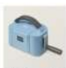
Mini-Stanz- Und Prägemaschine In Boho-Blau, Limitierte Edition 161104