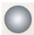
Stanzformen Kreise Mit Bütenrand 162286