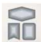
Stanzformen Sticknahl-Basics 161597