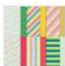
Designerpapier 12" X 12" (30,5 X 30,5 Cm) Lichterreigen 161945