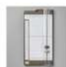
Papier Schneidemaschine 152392