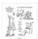
Stempelset Ablösbar Heitere Weihnachten (Deutsch) 162081